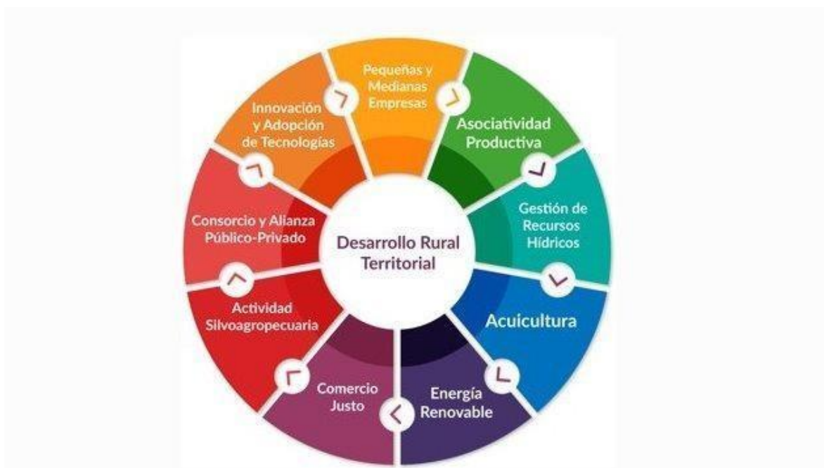
Ilustración 2. Áreas y temas de estudios de la Corporación Regional de Desarrollo Productivo.