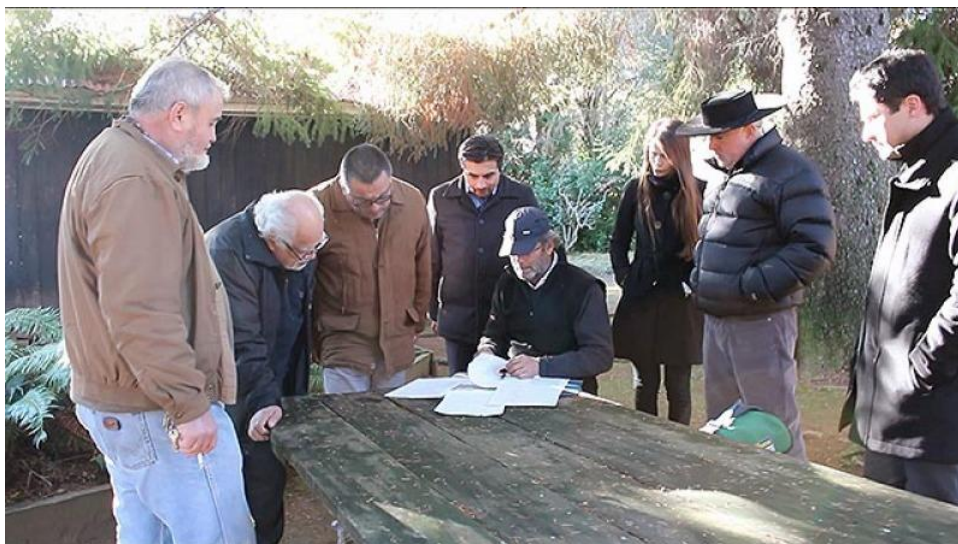
Ilustración 2. Autoridades regionales y provinciales establecen la ruta de trabajo para la construcción del camino.