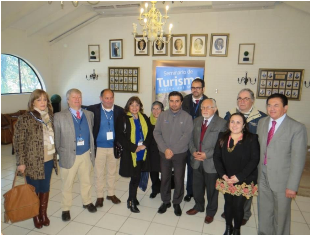
Ilustración 7. Consejo Regional, SEREMI, SERNATUR, CRDP del Maule. Seminario Provincial de Turismo de Curicó,