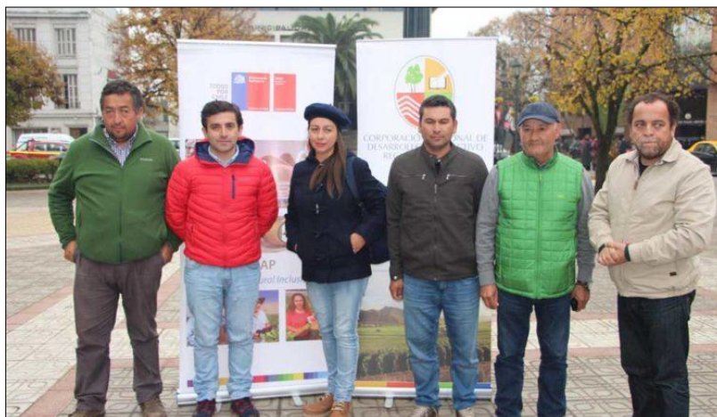
Ilustración 4. Captura de experiencias del modelo asociativo y del proceso productivo de Francia para fortalecer la cadena de valor en la producción de los viñateros del Maule”, delegación de seis pequeños productores vitivinícolas, director de INDAP y representante de la CRDP.

productivo de Francia, para fortalecer la cadena de valor en la producción de los viñateros de la región del Maule. Al final de la gira los viñateros destacaron el valor de la asociatividad de los pequeños productores franceses y como se hacen cargo de toda la cadena de producción del vino, desde la producción de uva hasta la venta final del producto. La gira tuvo una duración de 11 días – 29 de Mayo a 7 de Junio- la delegación la integraron seis pequeños productores vitivinícolas, el Director Regional del INDAP y un profesional de la Corporación.