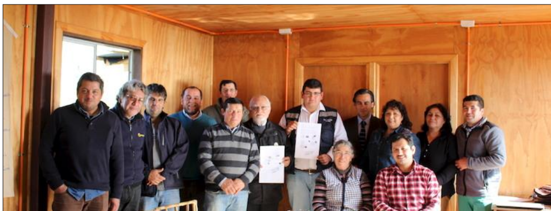
Ilustración 3. Conformación de la Red Acuícola de Pesca a Pequeña Escala.