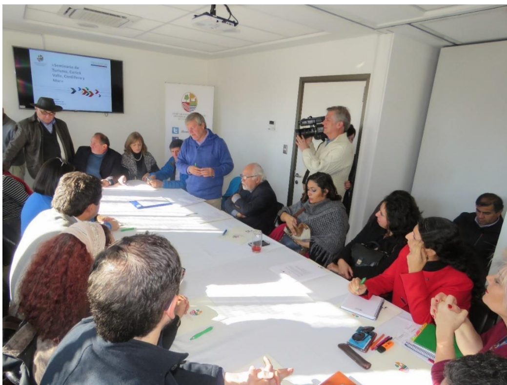
Ilustración 5. Mesa Técnica Seminario Turismo Curicó